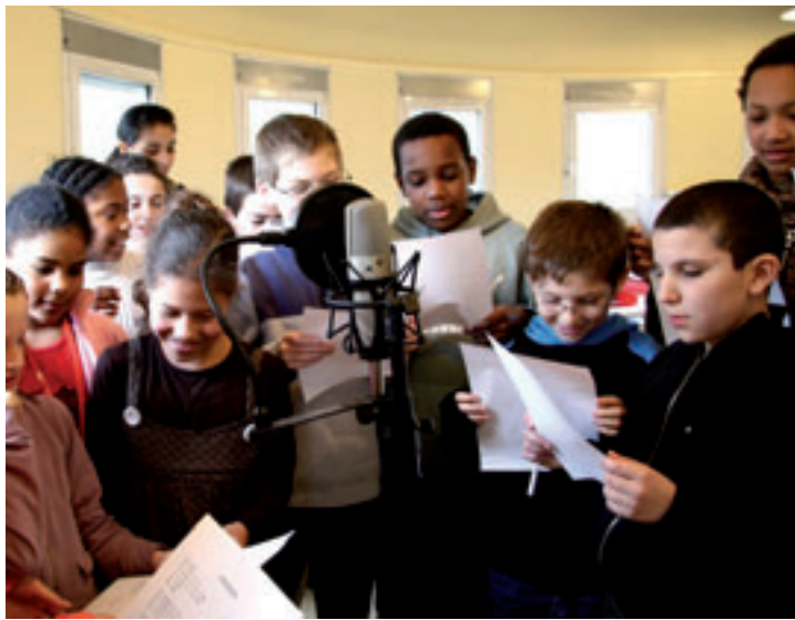
Atelier conseil d'enfants

L'an dernier, un projet commun a rassemblé les quatre conseils : un rallye photo sous la forme d'un jeu