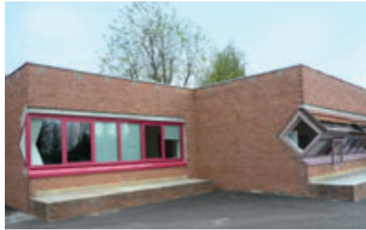
Nouvelles menuiseries (à gauche)

d'autres améliorations seront apportées au groupe scolaire, notamment la peinture et la mise à niveau de l'installation électrique pour l'intégration des nouvelles technologies numériques.