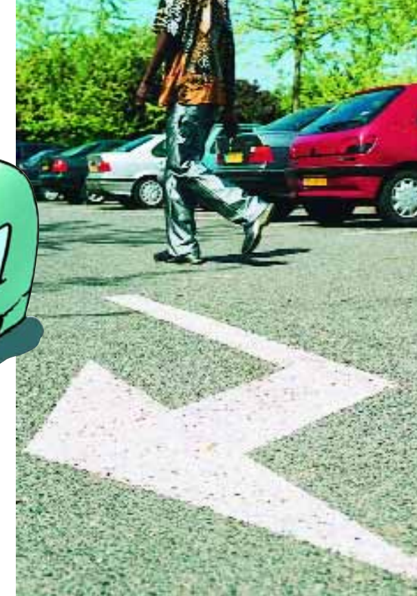
Deux cent vingt-huit places en zone bleue.

Compte tenu des travaux de rénovation qui démarrent au Grand Centre, il était impératif de réorganiser rapidement le stationnement dans ce secteur. Rue de la Préfecture notamment, les travaux de réhabilitation du parking des Arts ont nécessité sa fermeture provisoire. Par ailleurs, la chaussée est rétrécie et le stationnement interdit 50 mètres de part et d'autre des travaux. C'est donc en priorité dans ce quartier que vont être appliquées les nouvelles mesures, dès juin. Première disposition, la mise en place d'une zone bleue élargie pour améliorer le stationnement temporaire dans les rues situées tout autour de la dalle. Ces places sur voirie, plus nombreuses qu'auparavant, devraient faciliter l'accès aux commerces de proximité situés autour de la place de la Fontaine et permettre aux administrés de se rendre plus aisément aux services de la mairie annexe, de la Préfecture ou de la Communauté d'agglomération. Ce sont près de 228 places en zone bleue (repérables par les bandes bleues matérialisées au sol) qui vont être désormais accessibles aux automobilistes. Un stationnement gratuit, mais limité à 1 h 30, de 9 heures à 19 heures du lundi au samedi. Cette réglementation, qui fait l'ob-