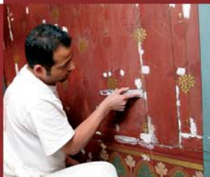
Peintre restaurant les motifs de l'autel Sacré-Coeur © Lionel Pagès Orgue mozartien avant sa restauration © DR

Restauré en atelier de menuiserie, l'autel latéral droit a été nettoyé et certaines pièces ou sculptures de bois remplacées. Une fois réinstallé dans l'église, le restaurateur de décor peint a donné une harmonie à l'ensemble en fixant ou en reproduisant les peintures anciennes ou trop abîmées et en réintégrant des bois neufs. Enfin, une patine générale permet de donner l'aspect vieilli à l'ensemble.