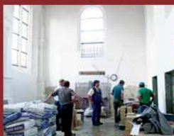
Décorateurs réalisant le vitrail en trompe l'œil © Lionel Pagès Narthex lors de sa restauration © Lionel Pagès

Afin de redonner les proportions de la baie gothique –obstruée il y a quelques siècles par la création d'un escalier en adossement à la façade sud – un vitrail peint en trompe l'œil a été réalisé selon la technique du marouflage. Cette technique consiste à peindre le tracé du vitrail sur une toile, qui une fois mouillée est appliquée contre le mur.