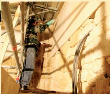
Maçon badigeonnant la partie haute des murs

Des décors peints ont été retrouvés sur chaque clé de voûte. Ils ont tous été consolidés et les couleurs initiales ont été refixées sur leur support d'origine.