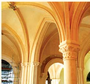
Carte postale ancienne de l'intérieur de l'église au début du siècle Vue d'ensemble des voûtes des travées nord et ouest après restauration