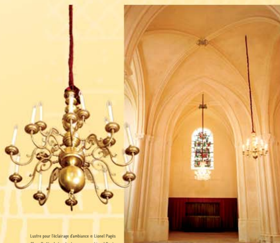
Lustre pour l'éclairage d'ambiance © Lionel Pagès Chapelle Nord et sa tenture rouge © Lionel Pagès